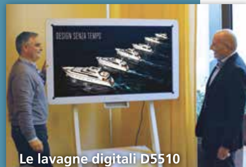
Le lavagne digitali D5510