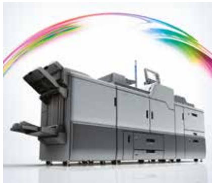
Pro C7100X, soluzione Ricoh con il 5° colore di stampa (bianco o trasparente).