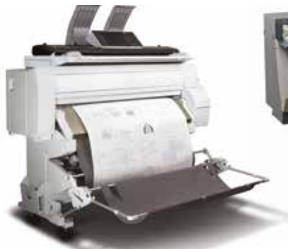
MPC W2200SP Grande Formato con scanner a colori.