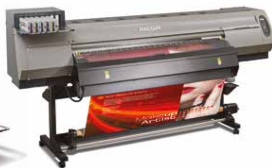
Ricoh Pro L4100 il Plotter con inchiostri latex che stampa su carta, pellicola e tessuto.