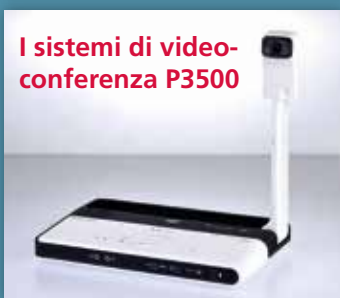
I sistemi di video-conferenza P3500