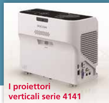
I proiettori verticali serie 4141