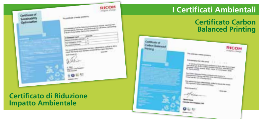
Certificato di Riduzione Impatto Ambientale

I clienti che aderiscono al progetto PP Green vedono ridotto considerevolmente il consumo di energia elettrica, il consumo di carta e la produzione di CO 2 . Al termine della procedura Ricoh Italia emette il Certificato di Riduzione Impatto Ambientale che prende in considerazione tutti i valori sopra citati. Con una procedura certificata a livello europeo viene anche consegnato il Certificato di Neutralizzazione della CO 2 ( Carbon Balanced Printing ), grazie al quale si abbattano completamente le emissioni di CO 2 mediante l'acquisto di CER ( Certified Emission Reduction ) cioè le quote di emissione riconosciute nell'ambito del "Meccanismo per uno Sviluppo Pulito" previsto dal Protocollo di Kyoto, in modo che l'azienda possa stampare a "impatto zero".