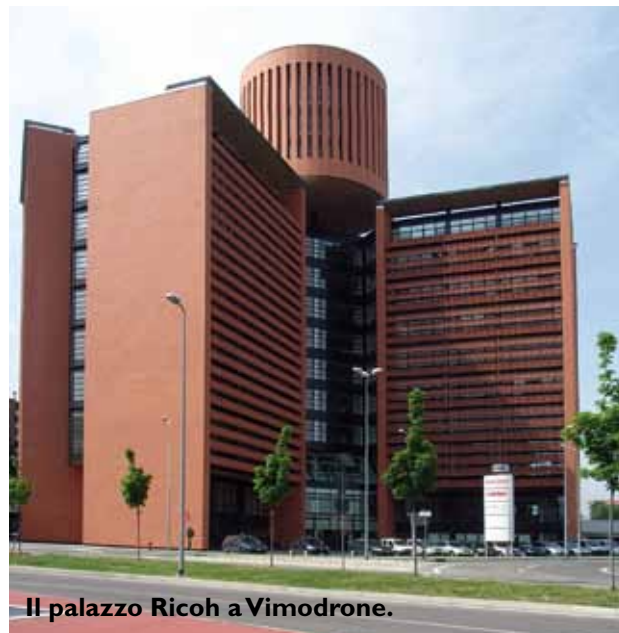
Il palazzo Ricoh a Vimodrone.

R icoh Italia Srl conta su circa 1.100 collaboratori. La presenza sul territorio è capillarmente distribuita ed assicurata direttamente o tramite Rivenditori, Concessionari e Partner. E' composta dalla sede principale di Milano, da 9 Filiali (Milano, Torino, Genova, Padova, Firenze, Bologna, Roma, Napoli, Palermo con Catania e Messina) e da 50 agenzie con localizzazione provinciale. I punti di Vendita Diretta coprono così le più significative aree economiche del Paese. Importante anche la struttura Indiretta, composta da oltre 1.000 Concessionari, Rivenditori, Distributori e da circa 80 Partner qualificati per la prestazione di servizi a più elevato valore aggiunto. Ricoh Italia si conferma quale leader di mercato nella fornitura di periferiche per l'ufficio (stampanti, multifunzione, dispositivi per l'alto volume ed il grande formato, fax), di sistemi per la stampa di produzione, di software per la gestione documentale e di servizi di gestione integrata, con la propria vasta esperienza di razionalizzazione delle apparecchiature e di riduzione dei costi nella produzione dei documenti. Secondo i dati di InfoSource (giugno 2010) Ricoh Italia ha una quota del 26,4% nel mercato totale delle apparecchiature multifunzione e del 34% nel segmento delle multifunzione a colori per l'ufficio, core business dell'azienda.