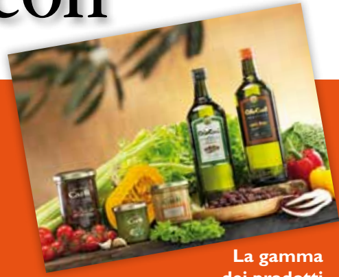
La gamma dei prodotti

Il PPPG ci ha consentito una razionalizzazione dell'ambiente di stampa: il numero dei dispositivi è stato ridotto del 48% senza che questo andasse a discapito delle funzionalità a disposizione degli utenti. Anzi il numero delle funzioni è addirittura aumentato grazie all'utilizzo dei sistemi multifunzione. Abbiamo ottenuto un risparmio del 18% sui costi rispetto alla situazione di partenza. Un aspetto interessante è poi quello ecologico: il PPPG consente una riduzione dell'impatto ambientale dei processi di stampa con dati certi e quantificati. I benefici riguardano anche il reparto IT e quello amministrativo che sono sollevati da tutti gli oneri gestionali (a carico del fornitore). Gli interventi di assistenza tecnica sono pressoché immediati a garanzia di dispositivi sempre disponibili. Con il software @Remote monitoriamo i volumi di stampa e il riordino del toner.