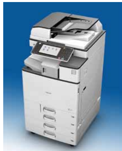
Ricoh MP C2003SP e MPC2503SP: due modelli in cui cambia solo la velocità di scansione e stampa.

La pinzatrice senza punti è un'esclusiva di Ricoh che permette di unire fino a cinque pagine senza bisogno di punti metallici. Si risparmiano risorse, non si devono rimuovere graffette quando servono i fogli sciolti e non si corre il rischio che i punti graffino il vetro di esposizione durante la scansione di un documento. Si tratta di un'opzione esclusiva di Ricoh.