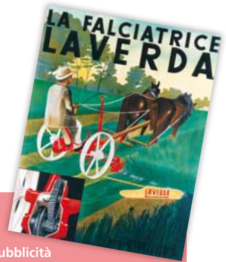
Publicità Laverda di fine '800.

Il nostro archivio è davvero imponente anche per la necessità di tenere almeno per 10 anni la documentazione cartacea. Avevamo quindi l'esigenza di ridurlo. Ricoh