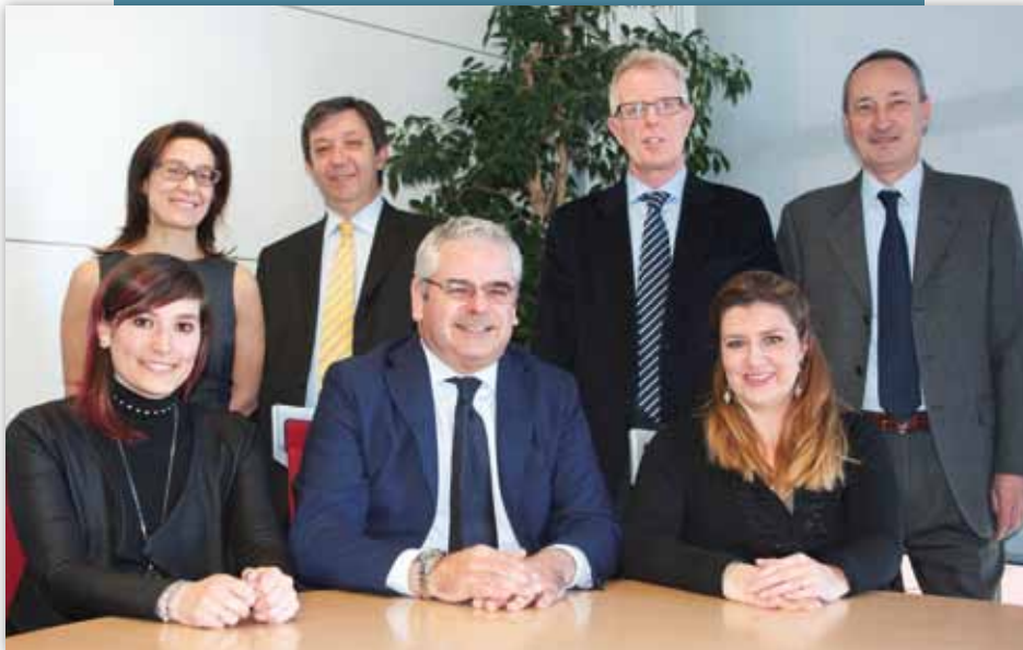
Lo staff della Business Unit Grandi Clienti.

Siamo in grado di gestire migliaia di attrezzature informatiche. Offriamo ai clienti la possibilità di conoscere il costo di ciascuna postazione di lavoro e di razionalizzare non solo il numero delle macchine ma anche i processi di gestione delle informazioni. Abbiamo l'ambizione di stupire i nostri clienti offrendo loro anche quello che non si aspetterebbero mai da un fornitore tradizionale.